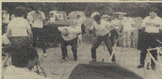
Walka do upadłego czyli trzeba umieć przegrywać. Dni Ziemi Koronowskiej-78.