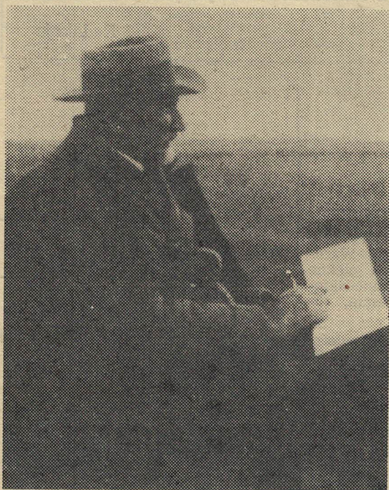
Leon Wyczółkowski na obrazie nieznanego autora