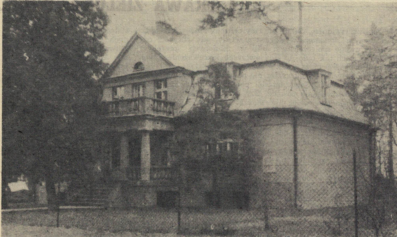
Dworek Wyczółkowskiego w Gościeradzu